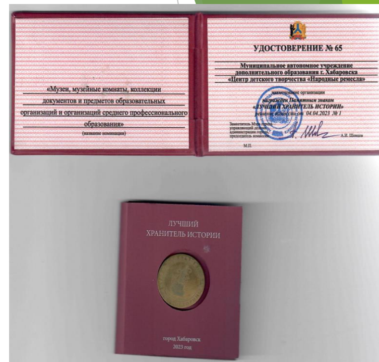
Конкурс «Лучший хранитель истории» 2023 г.