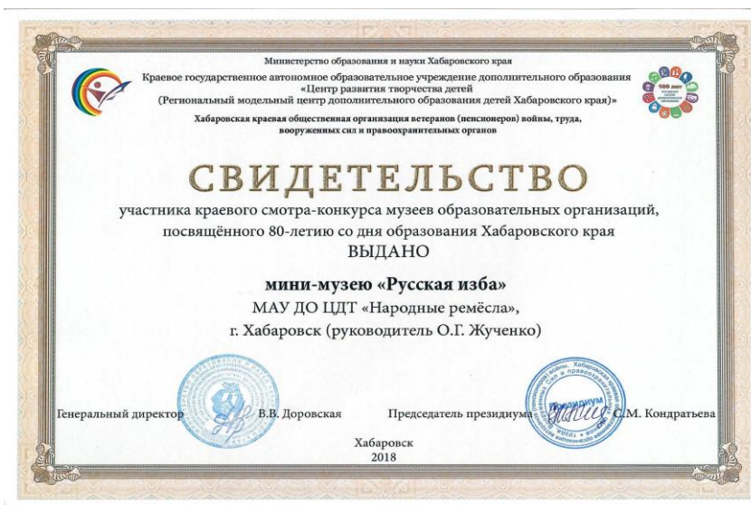
Свидетельство участника краевого смотра-конкурса музеев, посвященного 80-летию со дня образования Хабаровского края, 2018 г