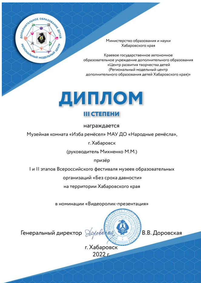
Конкурс «Без срока давности» 2022 г.